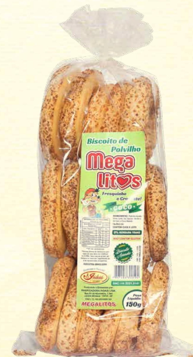
Biscoito de Polvilho Megalitos Coco 150g

VALIDADE: 5 MESES | CONTÉM ÓLEO DE COCO | NÃO CONTÉM GLÚTEN