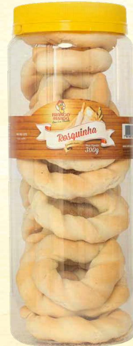
Rosquinha de Leite 300g