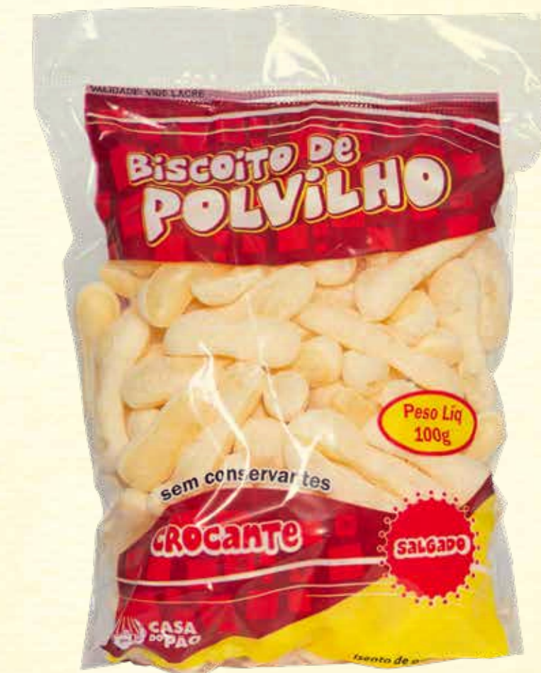
Biscoito de Polvilho Santuário 100g

VALIDADE: 5 MESES | CONTÉM ÓLEO DE COCO | NÃO CONTÉM GLÚTEN