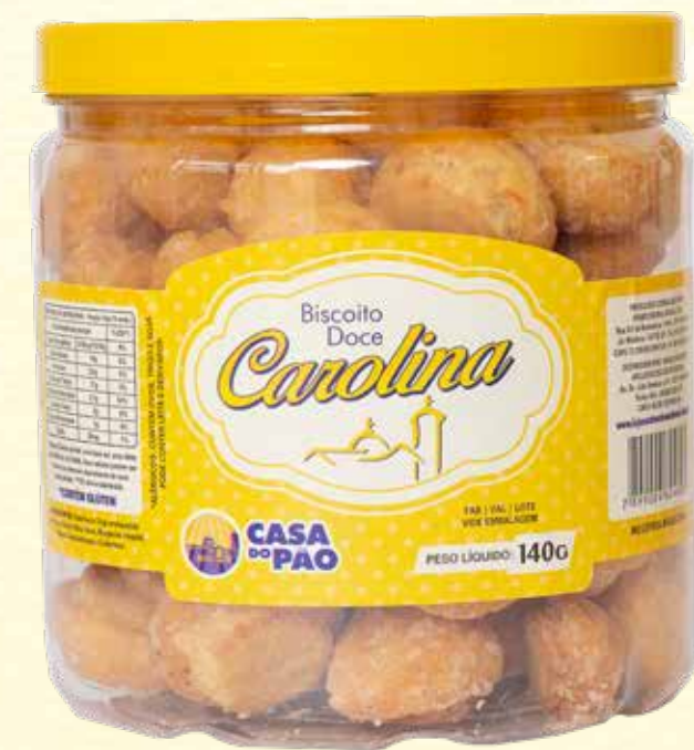
Carolina Açucarada 140g

Casa do Pão Santuário Nacional de Aparecida