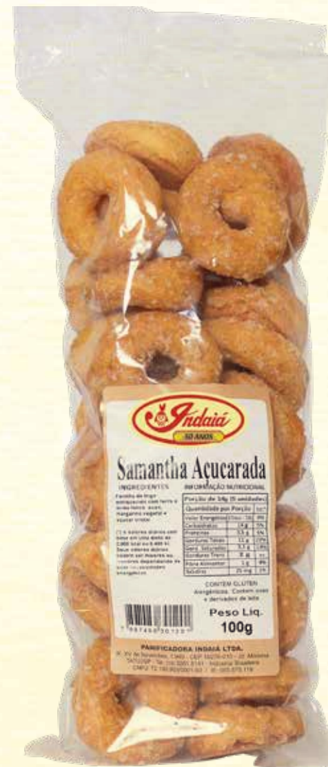
Samantha Açucarada 100g