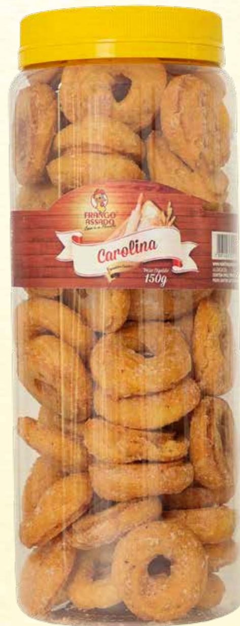
Carolina Açucarada 150g