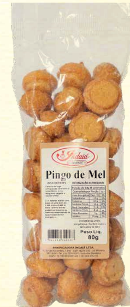
Biscoito Pingo de Mel 80g

VALIDADE: 5 MESES | CONTÉM ÓLEO DE COCO | NÃO CONTÉM GLÚTEN