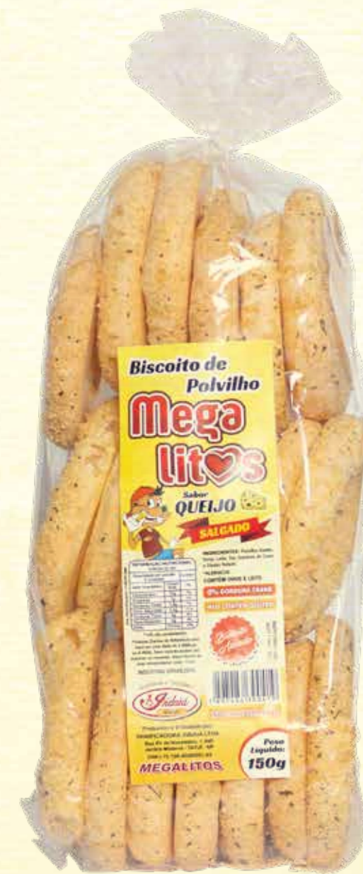
Biscoito de Polvilho Megalitos Queijo 150g