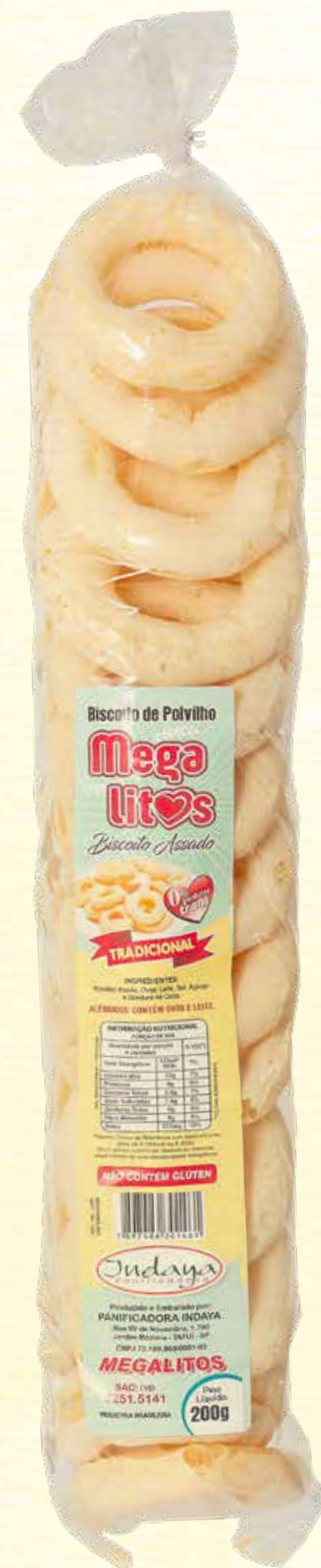
Biscoito de Polvilho Megalitos Tradicional 200g