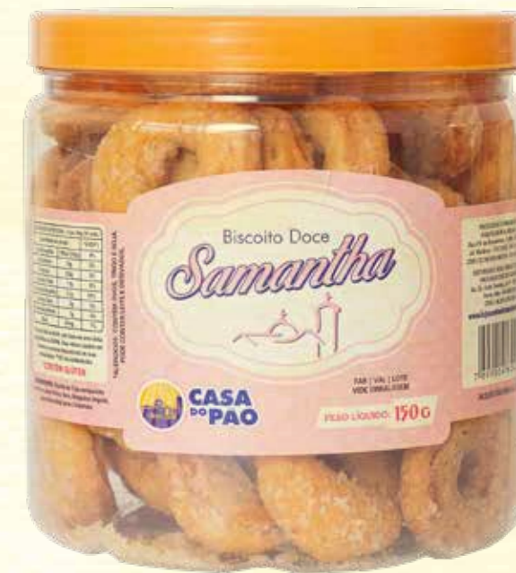
Samantha Açucarada 150g