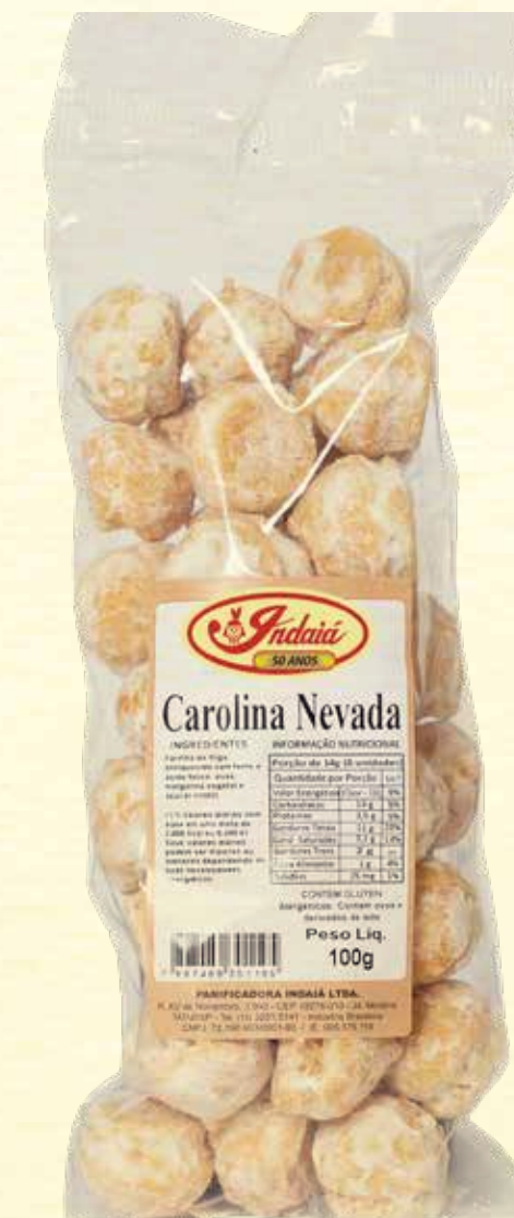
Carolina Nevada 100g

VALIDADE: 5 MESES | CONTÉM ÓLEO DE COCO | NÃO CONTÉM GLÚTEN