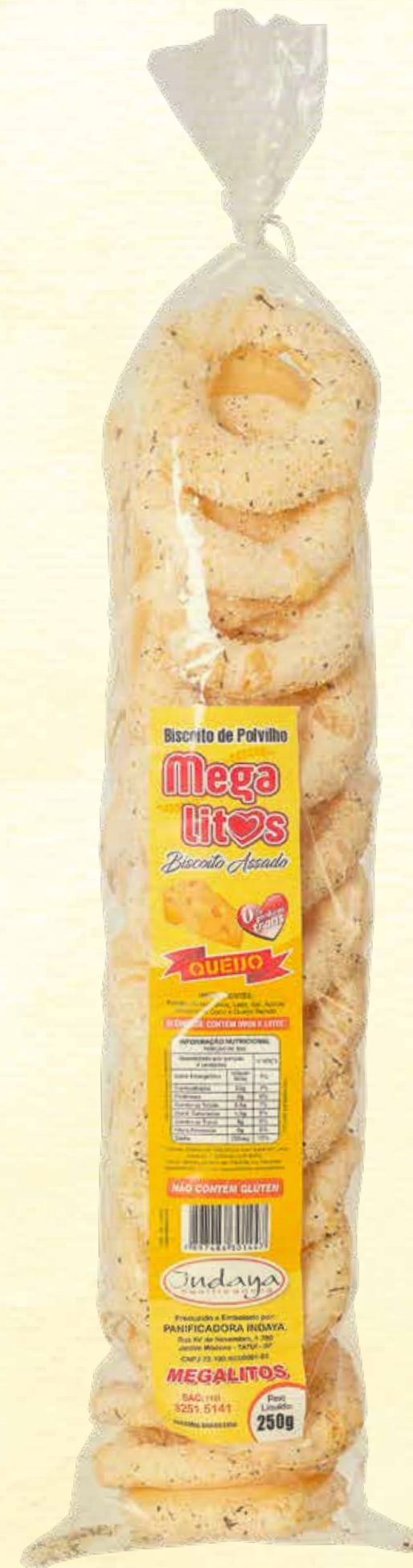
Biscoito de Polvilho Megalitos Queijo 250g