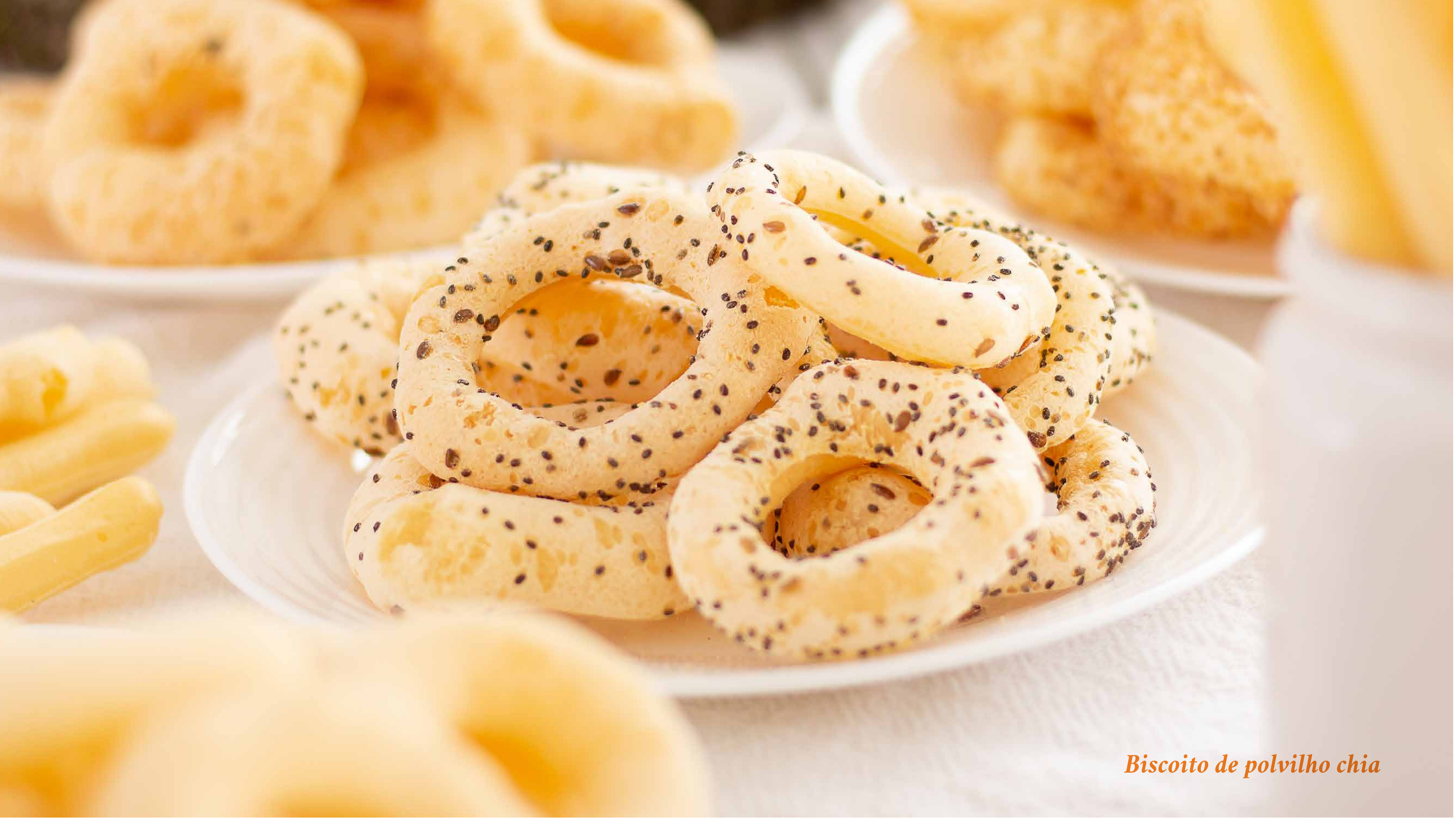
Biscoito de polvilho chia