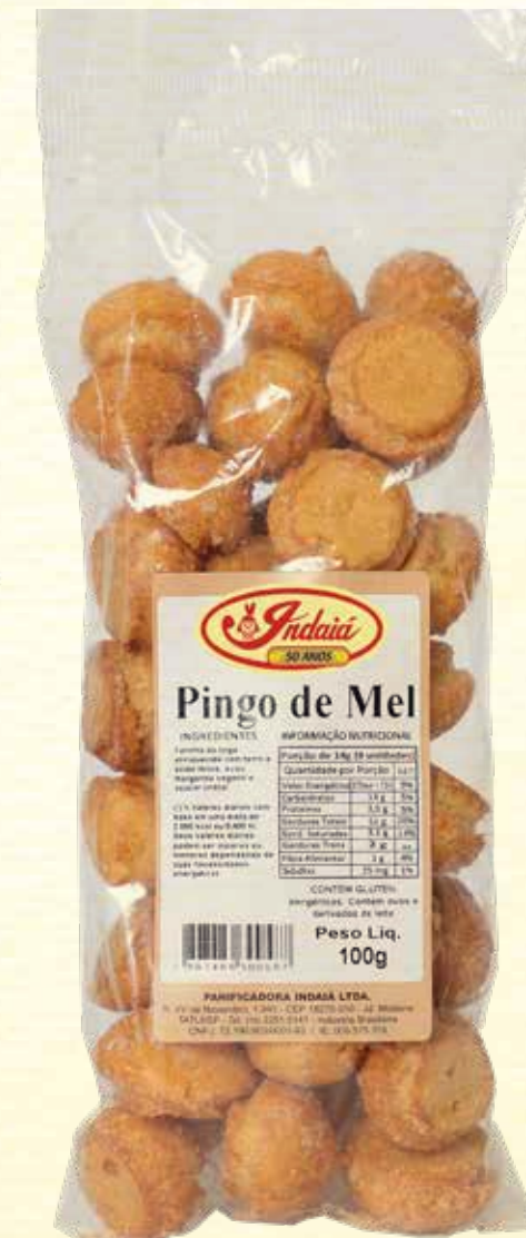
Biscoito Pingo de mel 100g