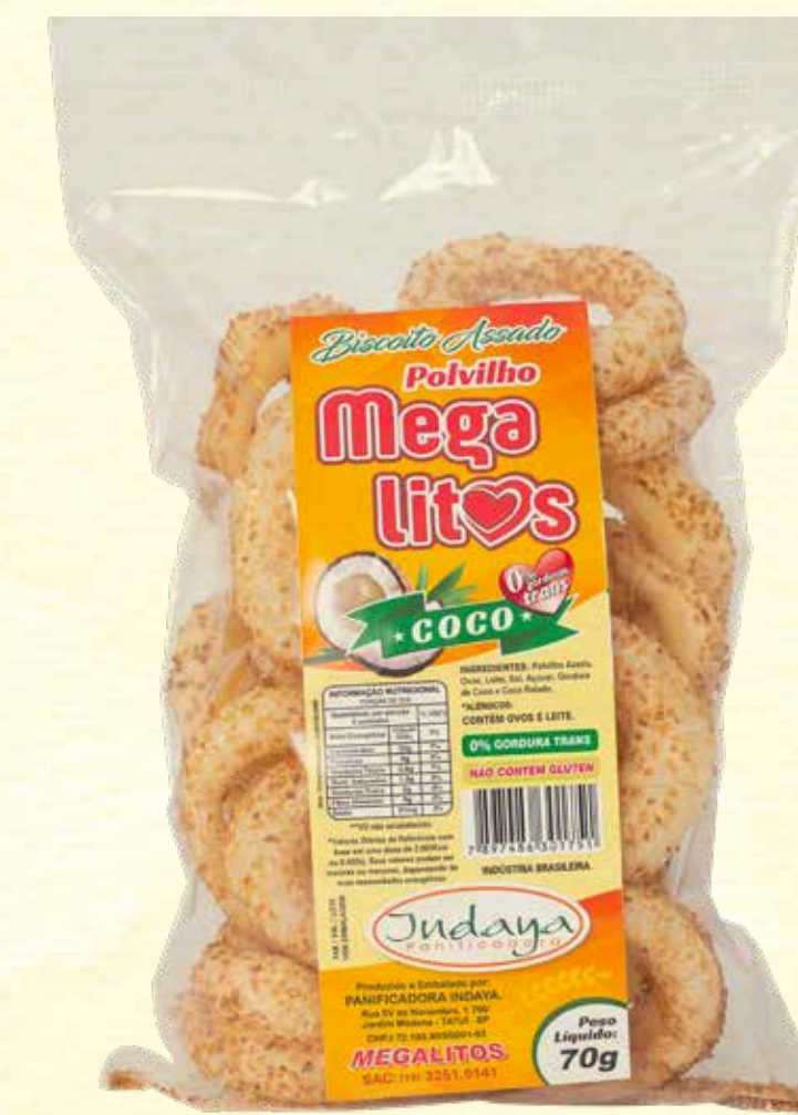
Biscoito de Polvilho Megalitos Coco 70g

VALIDADE: 5 MESES | CONTÉM ÓLEO DE COCO | NÃO CONTÉM GLÚTEN