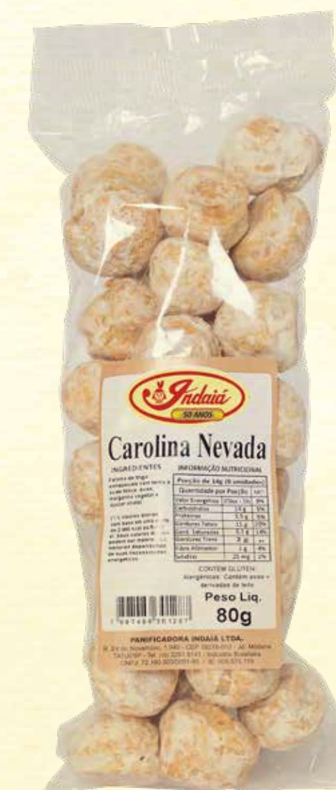
Carolina Nevada 80g