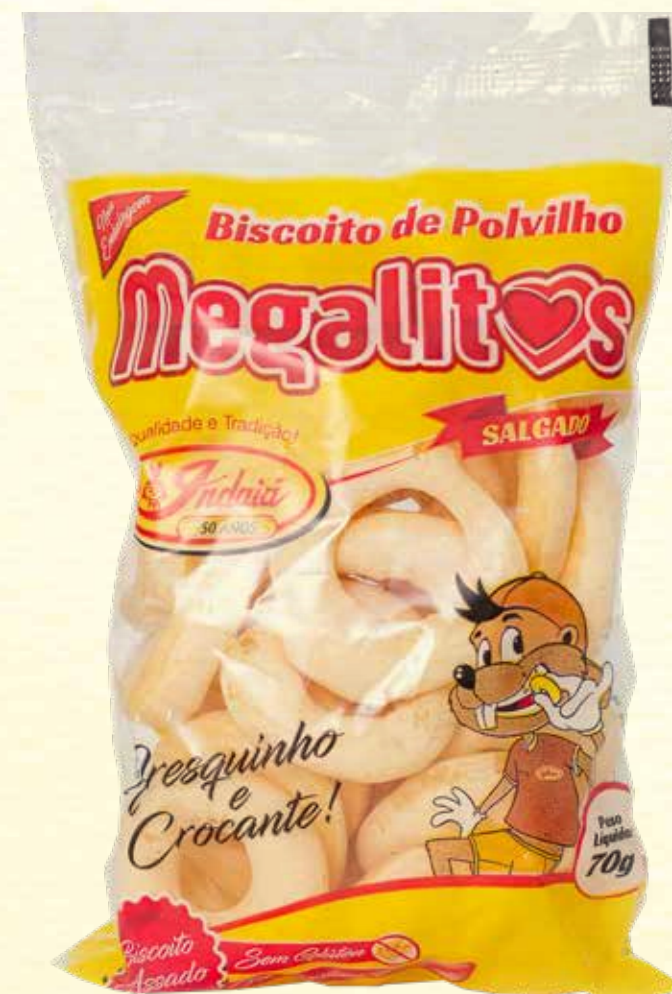
Biscoito de Polvilho Megalitos Argolas Tradicional 70g