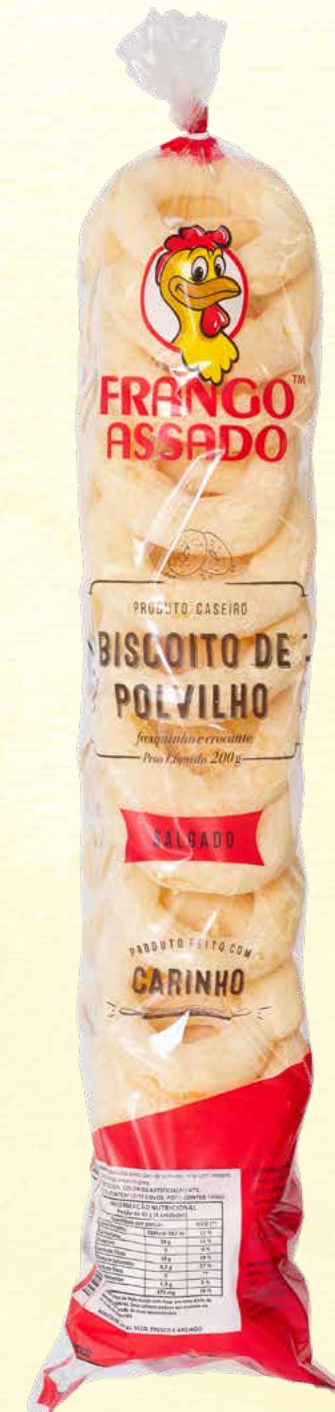
Biscoito de Polvilho Frango Assado 200g

VALIDADE: 5 MESES | CONTÉM ÓLEO DE COCO | NÃO CONTÉM GLÚTEN