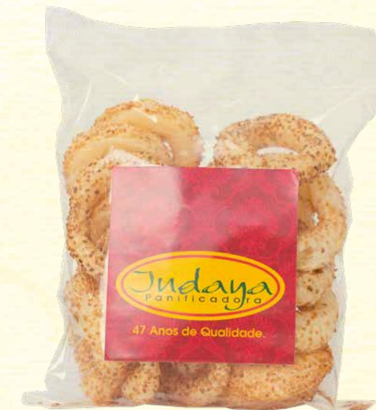
Biscoito de Polvilho Argola Coco 40g