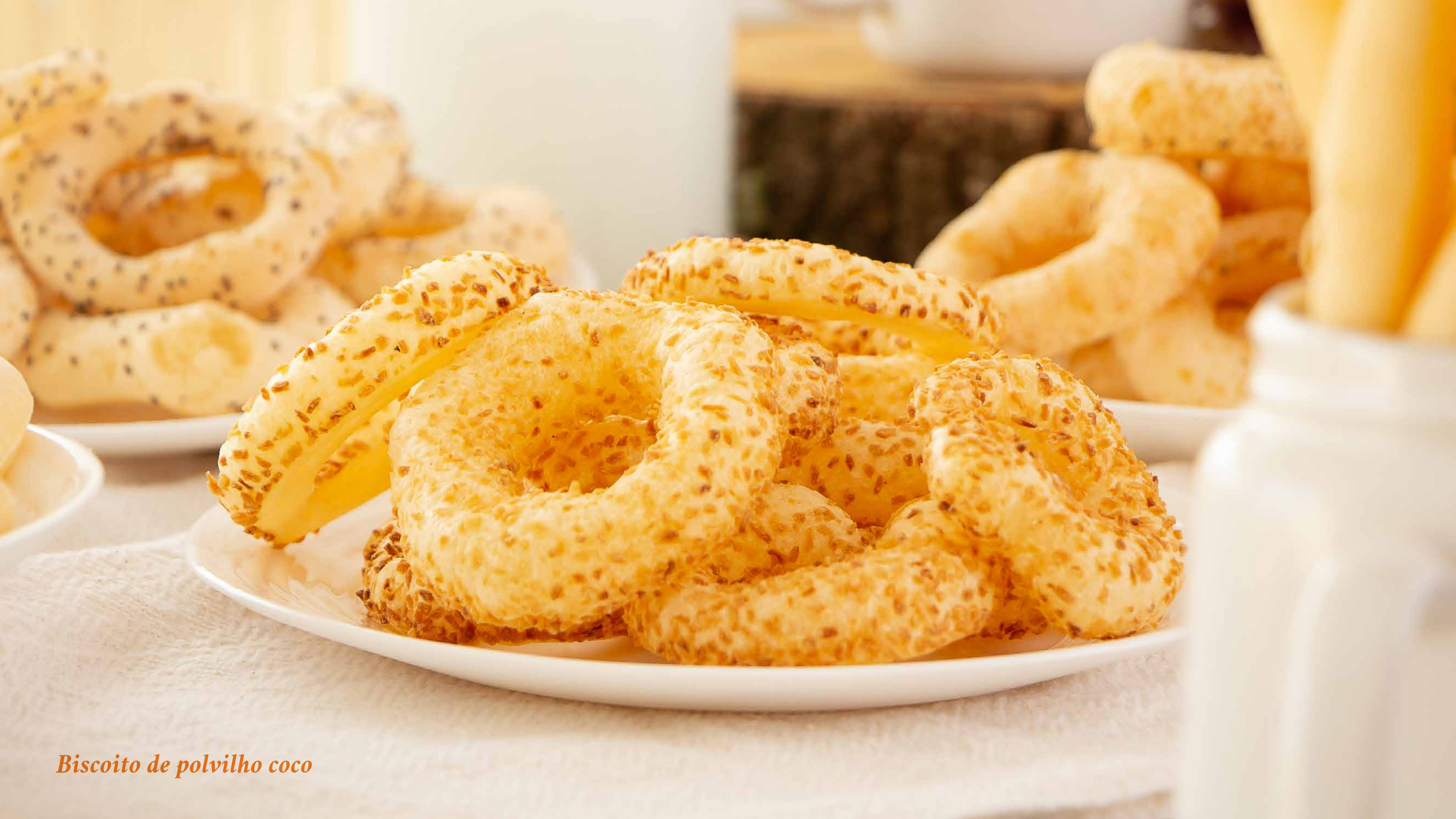
Biscoito de polvilho coco