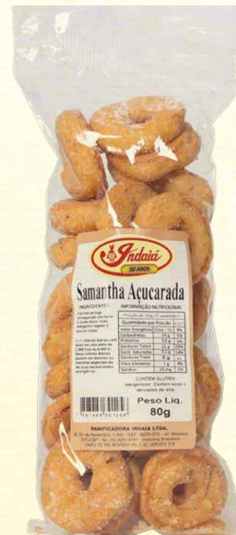
Samantha Açucarada 80g