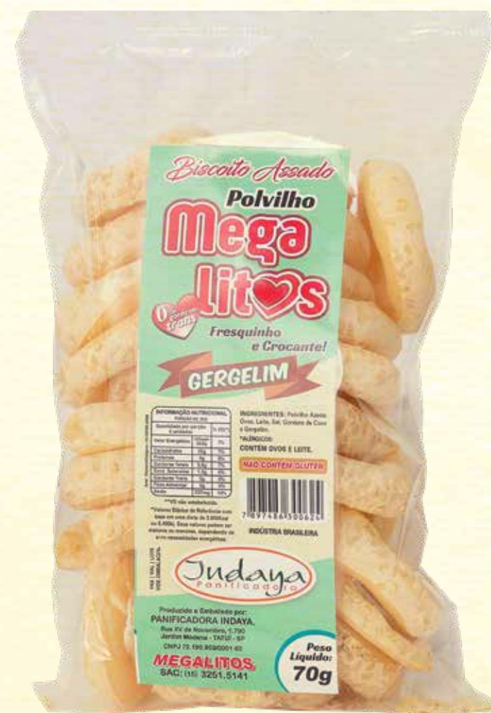
Biscoito de Polvilho Megalitos Gergelim 70g