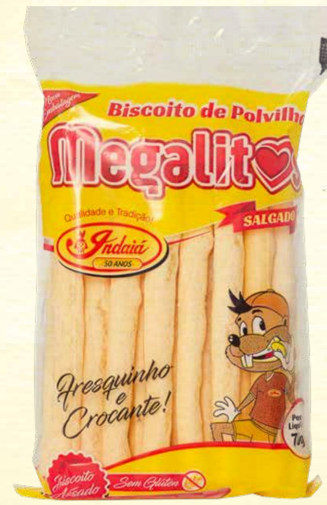
Biscoito de Polvilho Megalitos Palito Tradicional 70g