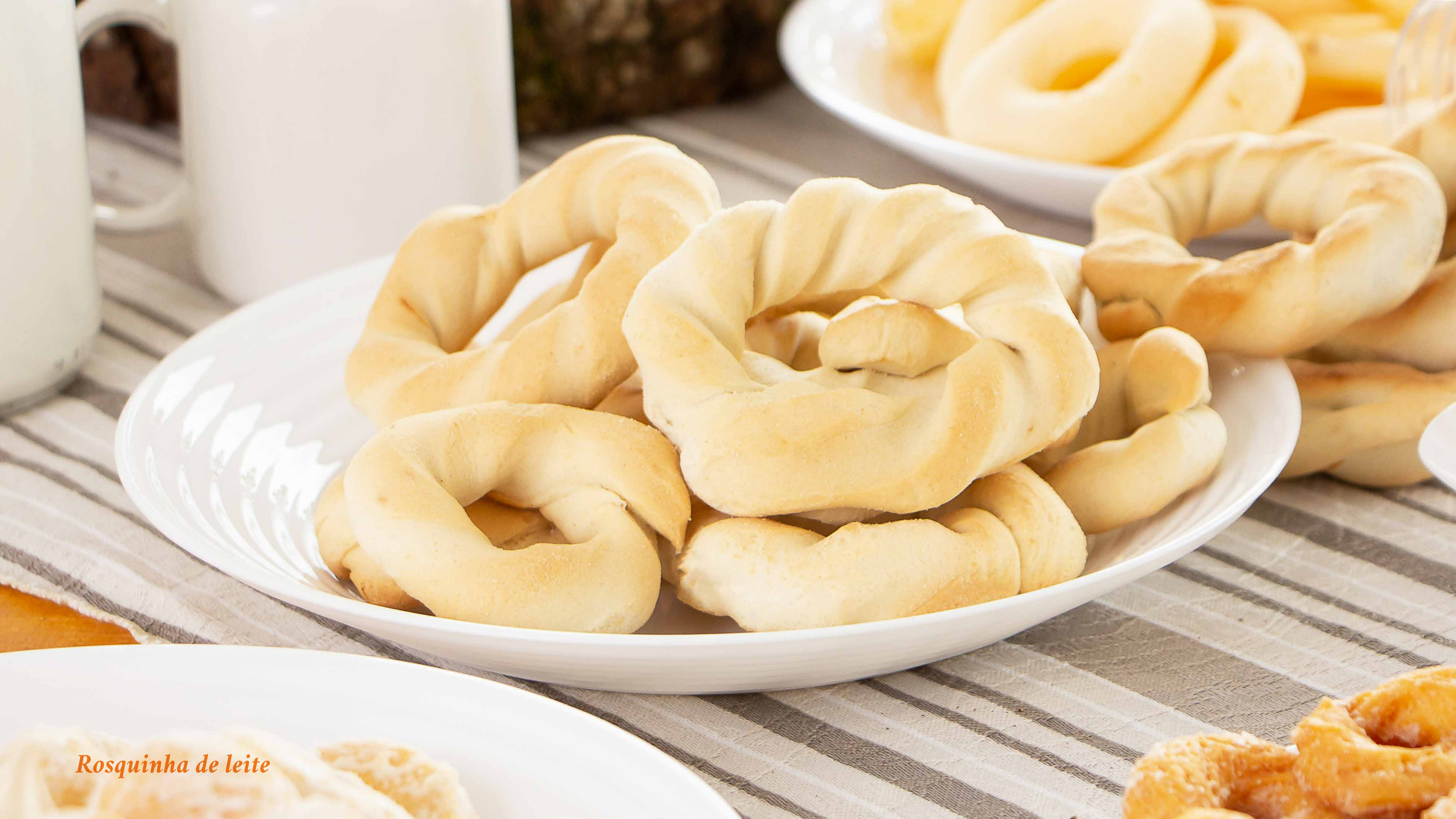
Rosquinha de leite