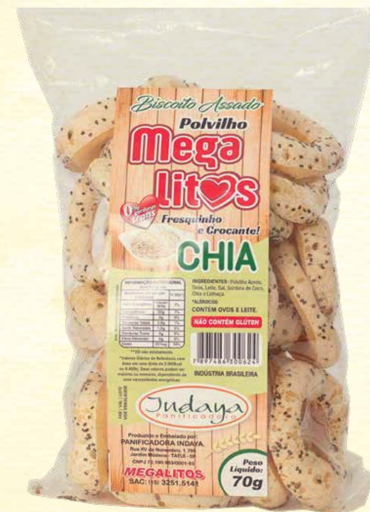
Biscoito de Polvilho Megalitos Chia 70g