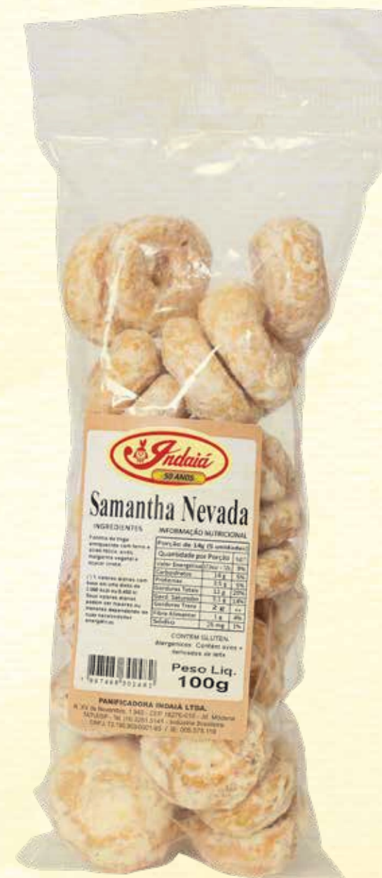
Samantha Nevada 100g