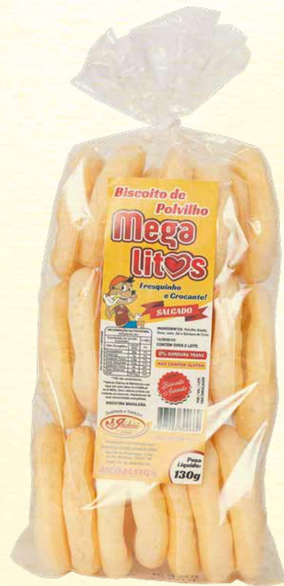
Biscoito de Polvilho Megalitos Tradicional 130g