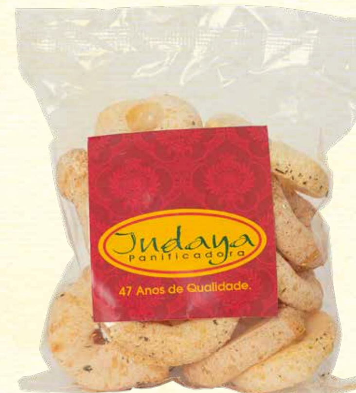
Biscoito de Polvilho Argola Queijo 40g