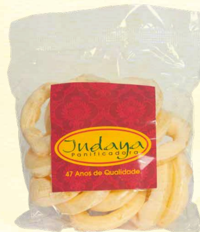
Biscoito de Polvilho Argola Tradicional 40g