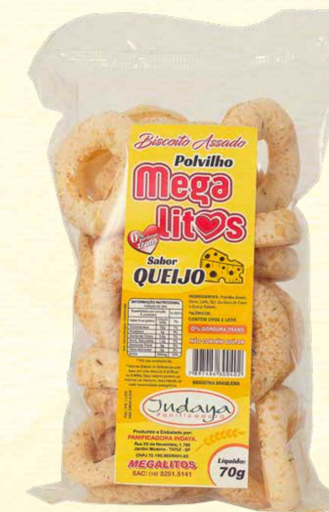
Biscoito de Polvilho Megalitos Queijo 70g

VALIDADE: 5 MESES | CONTÉM ÓLEO DE COCO | NÃO CONTÉM GLÚTEN