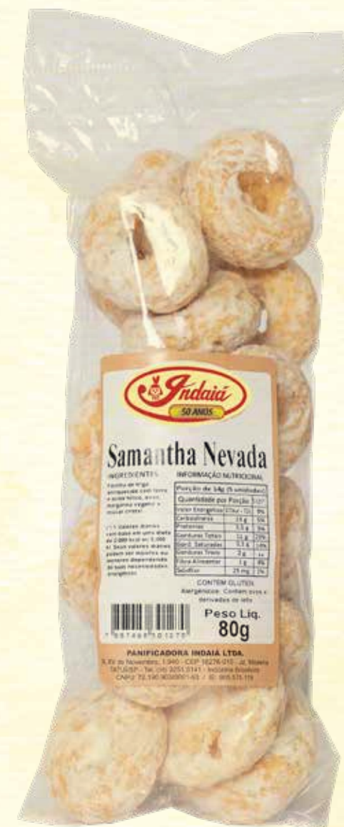
Samantha Nevada 80g