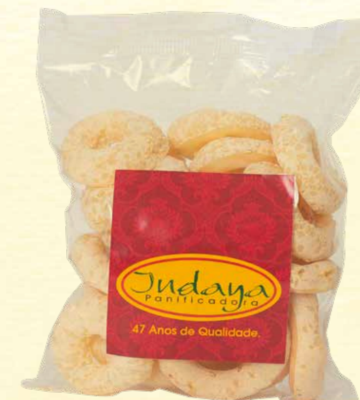
Biscoito de Polvilho Argola Gergelim 40g

VALIDADE: 5 MESES | CONTÉM ÓLEO DE COCO | NÃO CONTÉM GLÚTEN