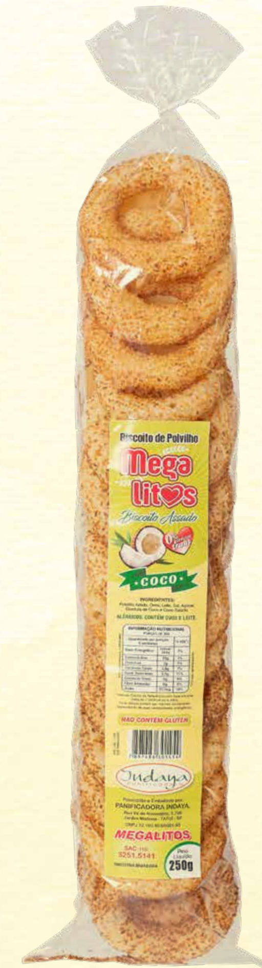
Biscoito de Polvilho Megalitos Coco 250g

VALIDADE: 5 MESES | CONTÉM ÓLEO DE COCO | NÃO CONTÉM GLÚTEN